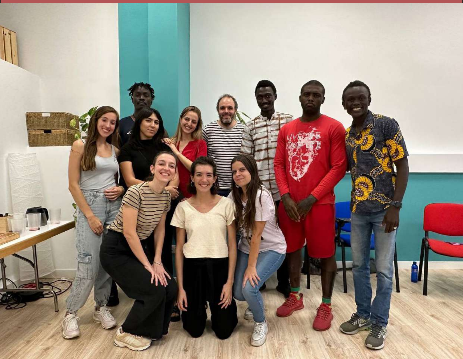
FOTOGRAFÍA DE UNA DE LAS SESIONES DE "ESPACIO TRANQUILO" EN EL CENTRO SIRA